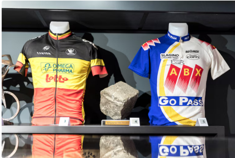
La Maison du Cyclisme a été inaugurée en présence d'anciennes stars du cyclisme.