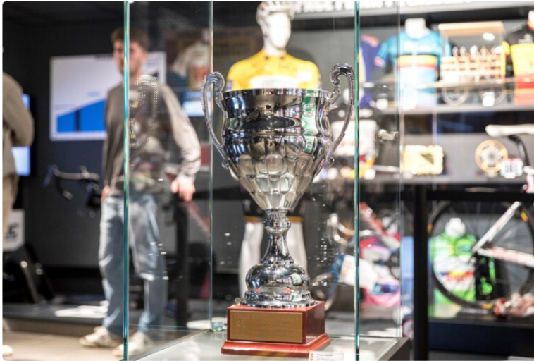
La Maison du Cyclisme a été inaugurée en présence d'anciennes stars du cyclisme.