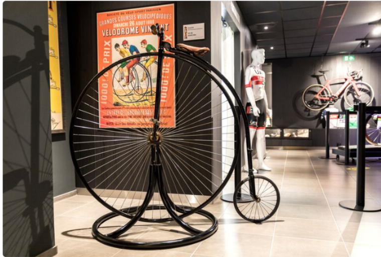
La Maison du Cyclisme a été inaugurée en présence d'anciennes stars du cyclisme.