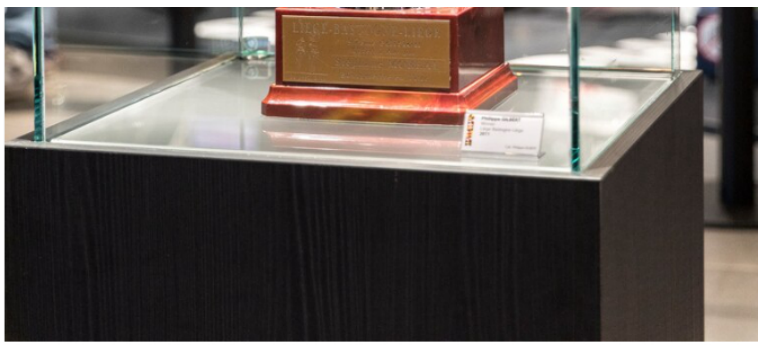
La Maison du Cyclisme a été inaugurée en présence d'anciennes stars du cyclisme.