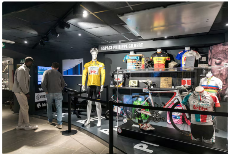
La Maison du Cyclisme a été inaugurée en présence d'anciennes stars du cyclisme.