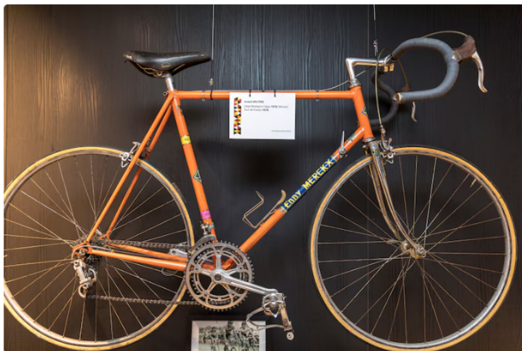
La Maison du Cyclisme a été inaugurée en présence d'anciennes stars du cyclisme.

Informations pratiques : www.lamaisonducyclisme.be